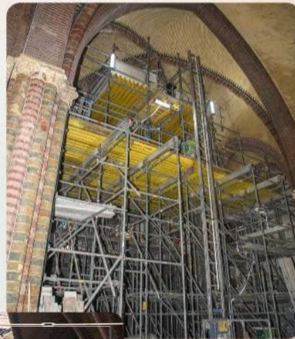
Tekst en foto: Richard Nieuwenhuizen

Al met al heb ik vier prachtige jaren mogen beleven, echt een tijd om nooit meer te vergeten. Hoe triest de aanleiding ook was! En toen de Vondelkerk ook (bijna) in vlammen opging, toen kwam alles ook terug. Wat mij altijd bij zal blijven is, na het verwerken van de eerste emoties, de enorme saamhorigheid hier in Bovenkerk, van de gemeenschap vooral. Want zonder dat was het herstel nooit gelukt. Ja, heel bijzonder!"